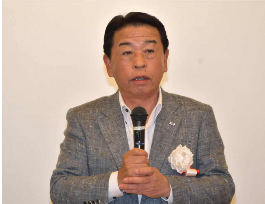
■ 副会長 閉会のことば