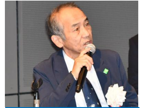
■ コーディネーター